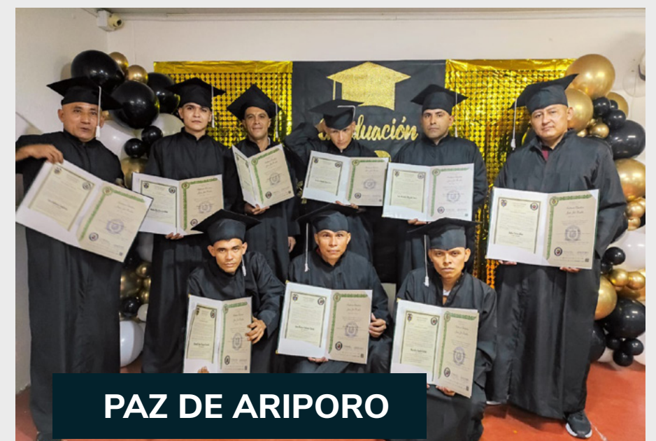
PAZ DE ARIPORO